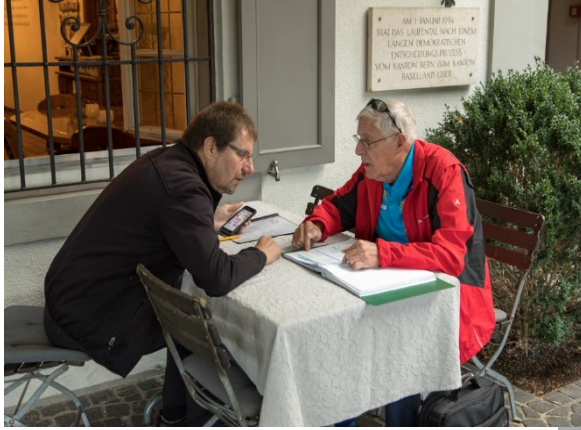
Lagegespräche mit dem Chauffeur !

Ohne nennenswerten Stau erreichten wir pünktlich das Museum „Port of Switzerland“ im Rheinhafen Basel – Kleinhüningen.